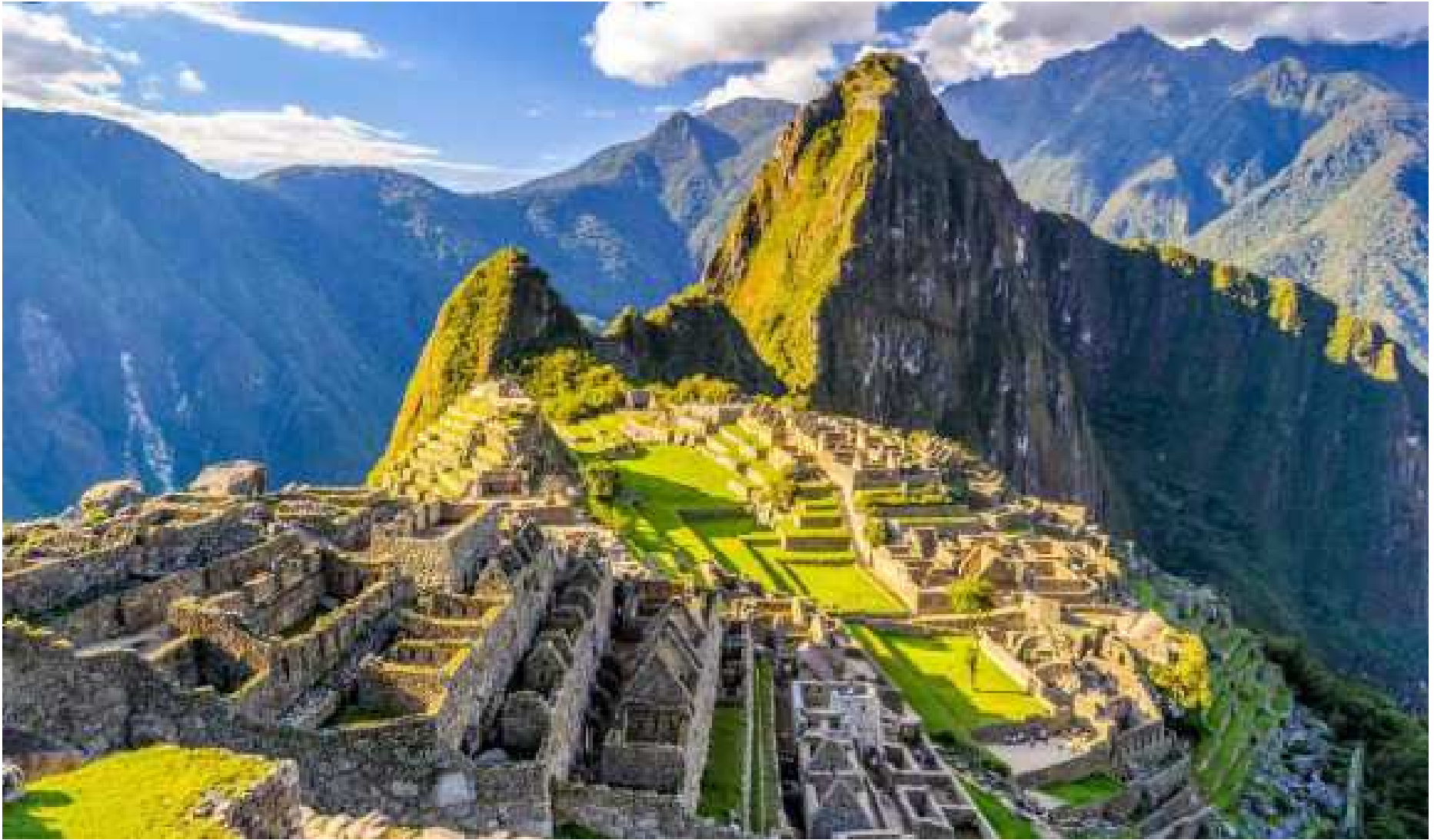
Le Machu Picchu (Pérou)